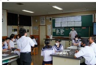
7月12日 理科 101