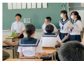
ビブリオバトルの様子101

図書委員会は、ビブリオバトルを企画・運営しました。この活動を通して、生徒は読書に親しみ、それぞれが自分の好きな本から得た思いや考えを伝え合う中で、話す力や聴く力を高めます。1年生の代表生徒は、11月に出身小学校を訪問し、小学生の前で実演します。また、未来屋書店と、おすすめの本を紹介し合うコラボ企画も行っています。現在、未来屋書店には、大曲中の図書委員が作成したポップとともに、おすすめの本が展示されています。この夏休みにも、すてきな本との出会いがあるといいですね。