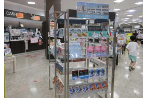
大曲中×未来屋書店 おすすめ本紹介コーナー