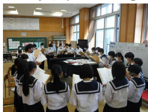
6月12日 音楽 304

学校生活の大半は授業です。今年度大曲中では、この研究主題の下、生徒の思考力・判断力・表現力を高め、主体的な学びを促す手立てを重点に、授業改善を進めています。今年度もたくさんの研究授業が計画されており、ここまでに3教科の研究授業を実施しました。どの授業でも、落ち着いた前向きに授業に臨む生徒の姿が評価されています。生徒の姿を大切に見取り、成果と課題を確実につなぎ、全教職員でよりよい授業づくりに取り組んでいきます。