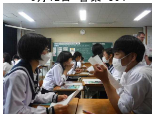
7月12日 英語 204